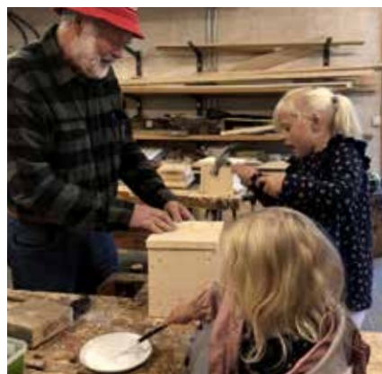
Bilder fra Soppkurs og Åpen Økologisk Gård og Gøy på landet med 4-H