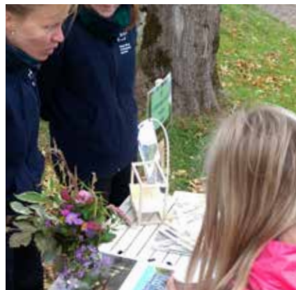
Bilder fra Grønn karrieredag